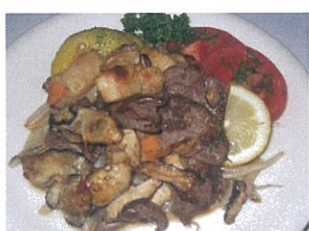
森と海からの恵み 1,560円+税