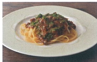
伊賀産鹿肉のポロネーゼ