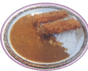
シカコロ三種カレー