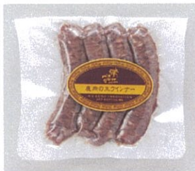
鹿肉のウインター