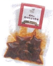
鹿肉の角切りピリ辛味