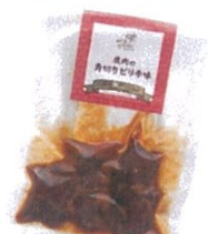
鹿肉の角切りピリ辛味