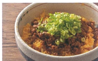
伊賀産鹿肉とほろ丼